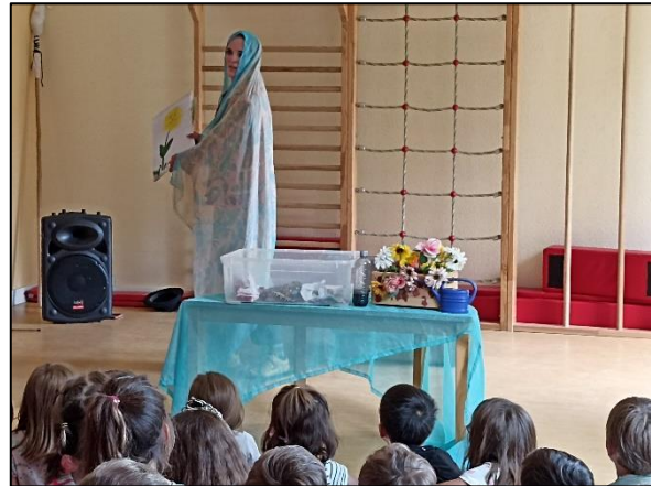
- Kita Saalmühle, Ingelheim

„Heute hat uns Frau Ratzel mit Ihrem Wassermärchen beglückt. Ganz kindgerecht hat sie den Kindern vermittelt, wie wichtig sauberes Wasser für uns ist und wie achtsam wir damit umgehen sollen. In dem Märchen gab es zum Glück eine gute Fee, sodass am Ende alles gut ausgegangen ist und das Wasser wieder sauber war, der Fisch wieder leben konnte etc. Und zum Abschluss kam das Highlight für die Kinder – wundervolle kreative Seifenblasen. Vielleicht hinterlässt die Fee ja ein paar Spuren. Es war wunderschön. Dankeschön.“