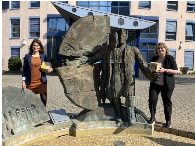
KV Mainz-Bingen / D. Gebhard