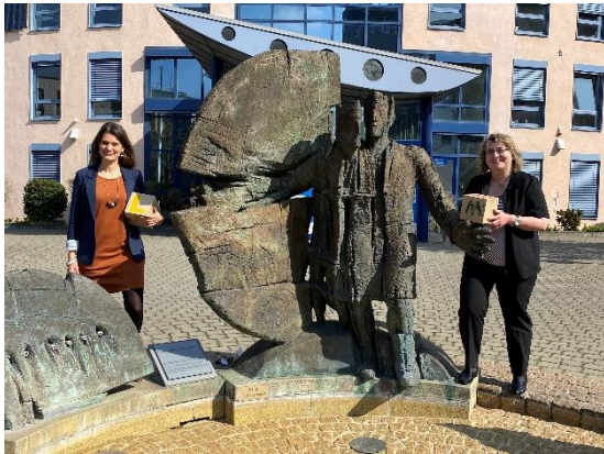
KV Mainz-Bingen / D. Gebhard

Damit das Ganze auch gut funktioniert, gibt es im Landkreis noch die Koordinierungsstelle, die für eine gute Zusammenarbeit sorgt. Diese Stelle ist allerdings nicht direkt mit der Hilfe betraut, sondern steuert das Gesamtprojekt