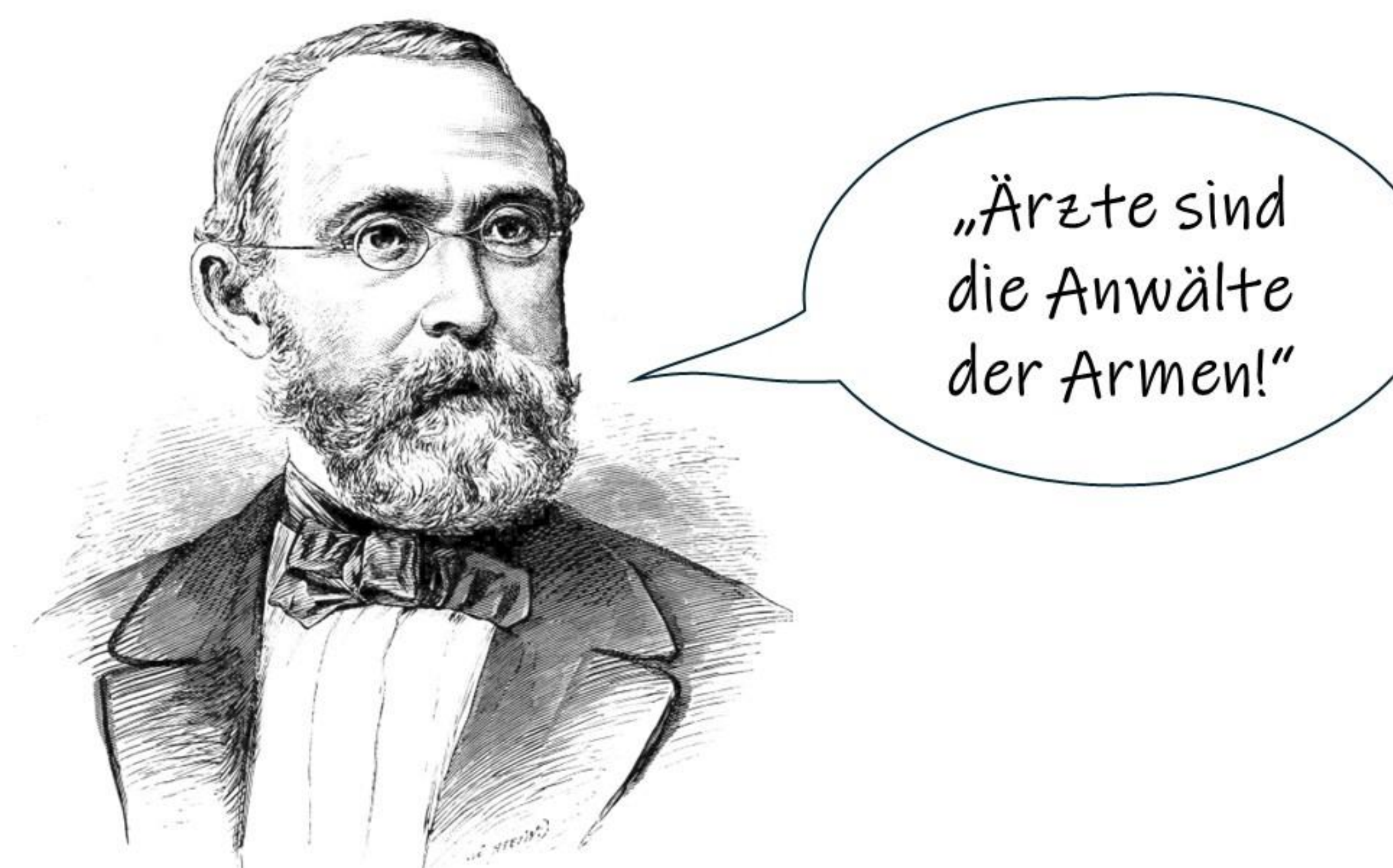
Rudolf Virchow (1821-1902)